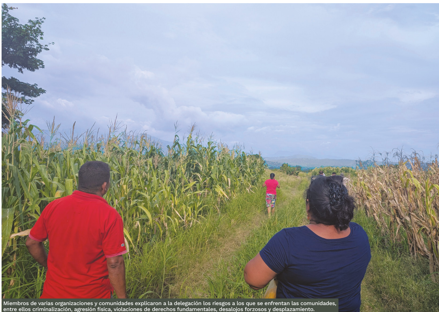
Miembros de varias organizaciones y comunidades explicaron a la delegación los riesgos a los que se enfrentan las comunidades, entre ellos criminalización, agresión física, violaciones de derechos fundamentales, desalojos forzosos y desplazamiento.

82 En la misma oportunidad, representantes de la CNTC expresaron que existen varios procesos judiciales contra mujeres de la organización, incluidas integrantes del movimiento campesino de Las Galileas, las cuales han sido objeto de un desalojo violento y de criminalización en el contexto de su lucha para que el INA les conceda las tierras que necesitan para sobrevivir y alimentar a sus hijos 56 .