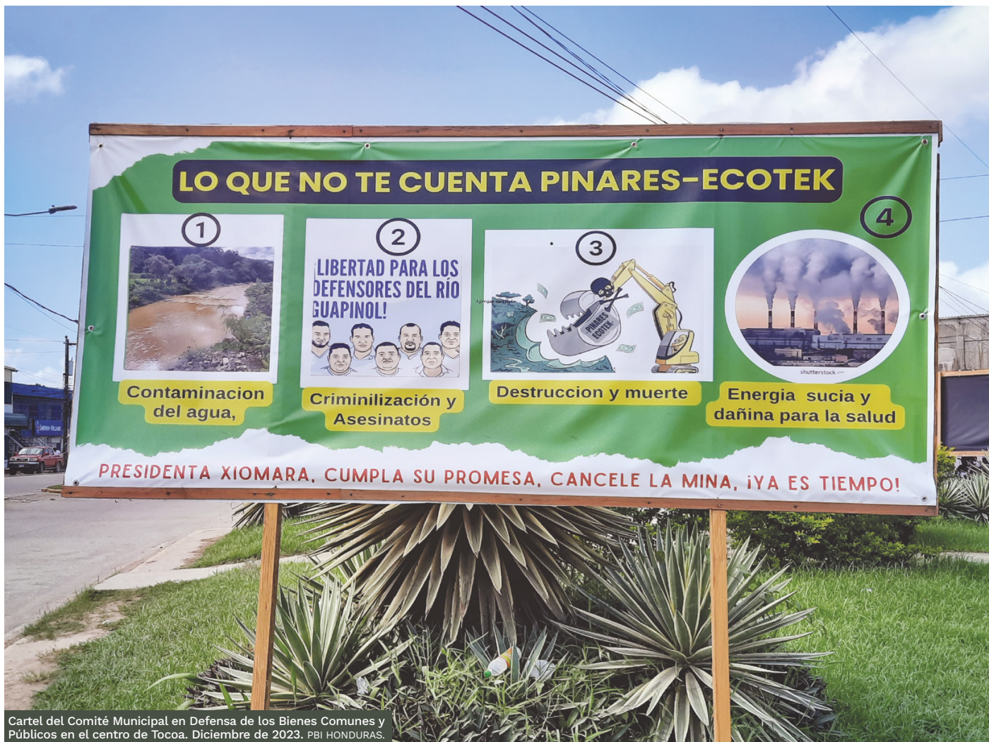
Cartel del Comité Municipal en Defensa de los Bienes Comunes y Públicos en el centro de Tocoa. Diciembre de 2023.

agroindustriales ha derivado en cientos de atentados, asesinatos y amenazas. La utilización de estructuras criminales, así como de grupos paramilitares 8 , es uno de los principales ingredientes del control territorial ejercido por algunas empresas que operan en la región.