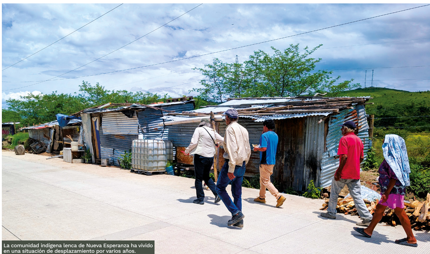
La comunidad indígena lenca de Nueva Esperanza ha vivido en una situación de desplazamiento por varios años.