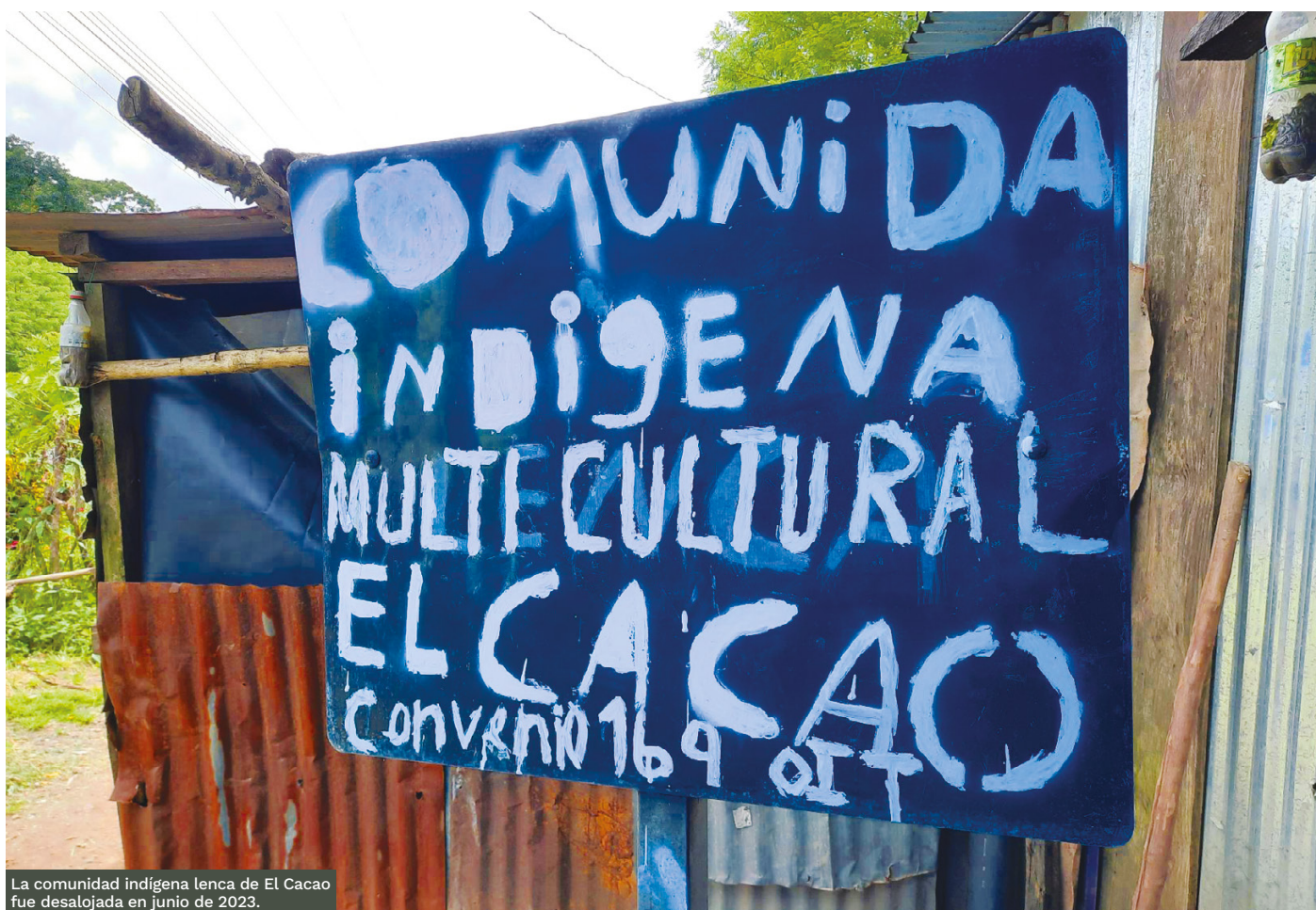
La comunidad indígena lenca de El Cacao fue desalojada en junio de 2023.