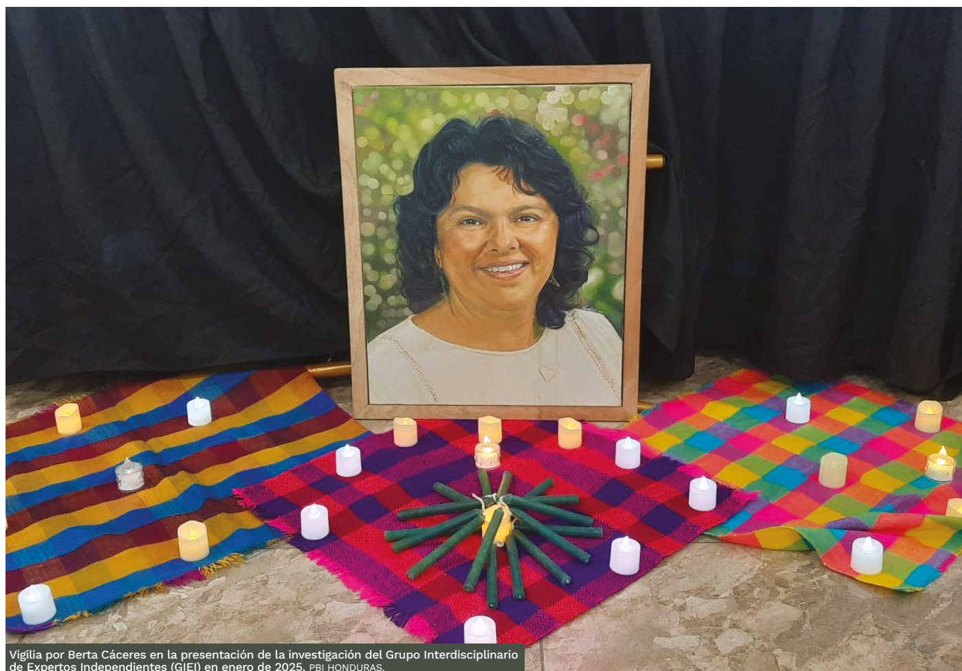
Vigilia por Berta Cáceres en la presentación de la investigación del Grupo Interdisciplinario de Expertos Independientes (GIEI) en enero de 2025.