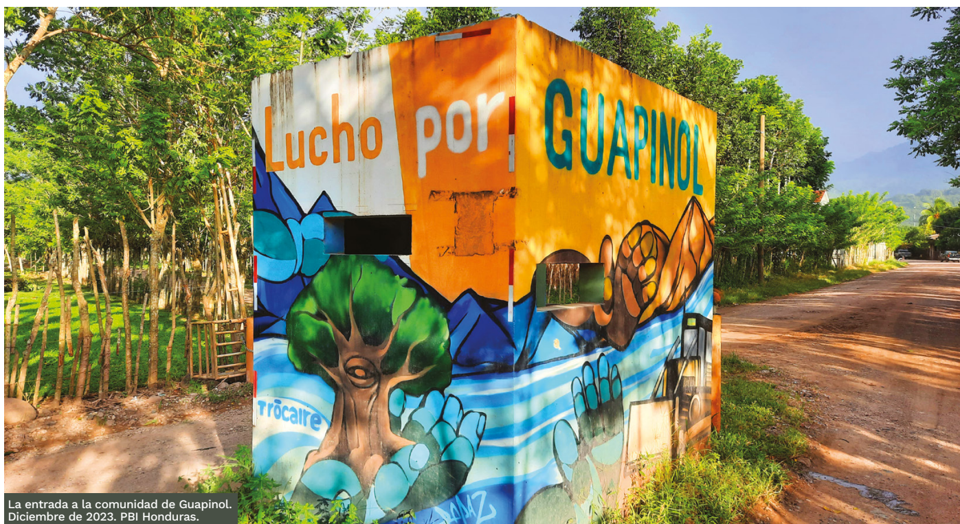
La entrada a la comunidad de Guapinol. Diciembre de 2023. PBI Honduras.