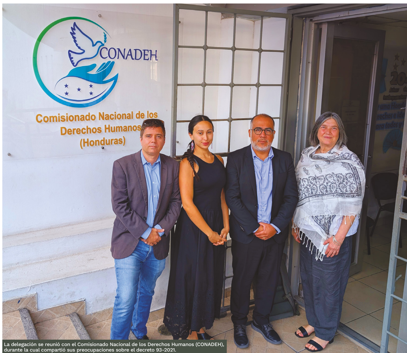
La delegación se reunió con el Comisionado Nacional de los Derechos Humanos (CONADEH), durante la cual compartió sus preocupaciones sobre el decreto 93-2021.

“De acuerdo con la información recibida, varias mujeres defensoras garífunas habrían sido detenidas y estarían sujetas a procesos penales derivados de dos requerimientos instaurados por el Ministerio Público por la presunta comisión de los delitos de daños, amenazas, robo y usurpación de tierras, que tendrían su origen en una disputa civil con terceros, por la falta de delimitación de las tierras ancestrales de las comunidades garífunas de Cristales y Río Negro” 122 .