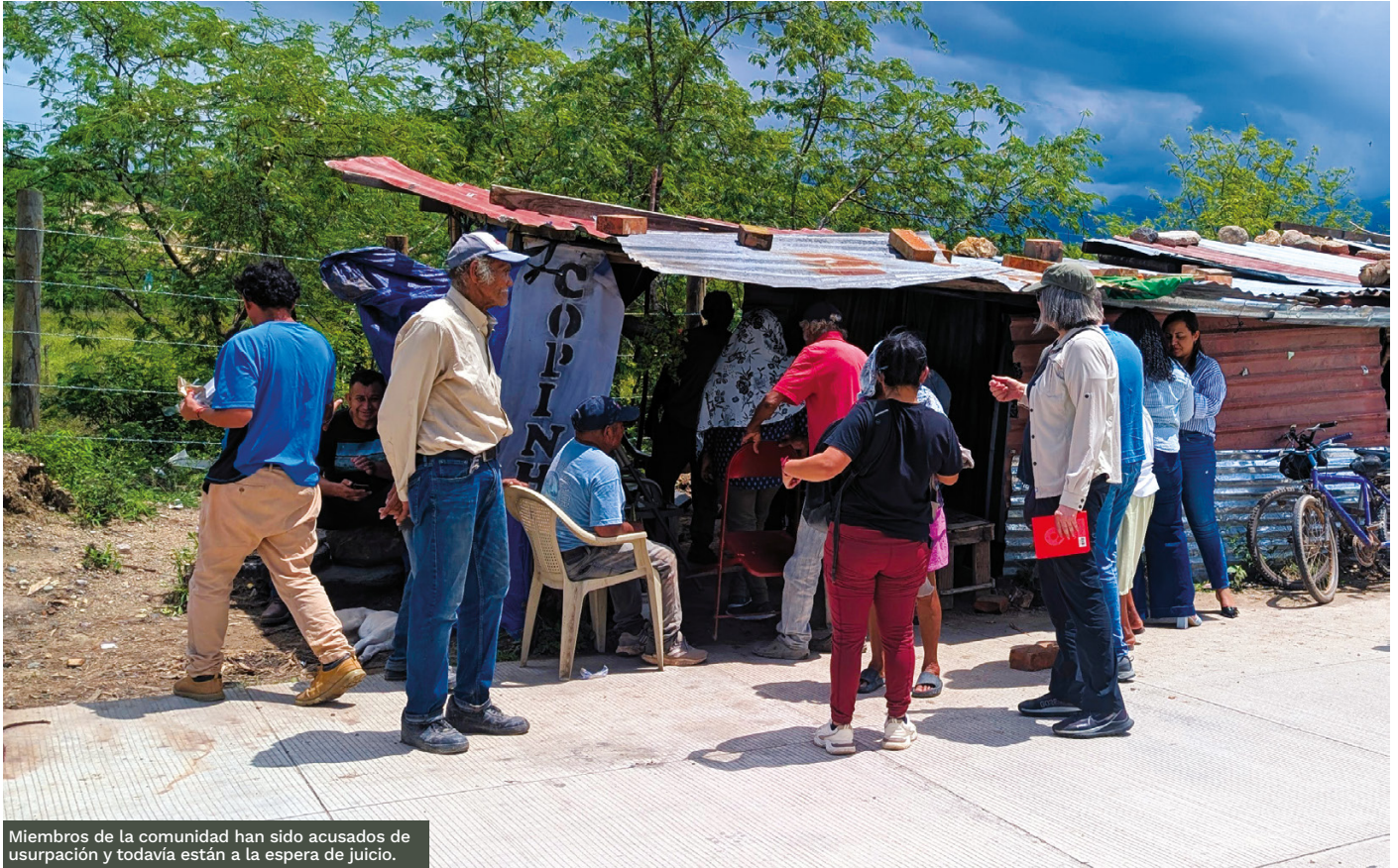
Miembros de la comunidad han sido acusados de usurpación y todavía están a la espera de juicio.

su situación. Sus integrantes carecen de acceso a servicios básicos, sin comida suficiente, se lavan en un río cercano, compran agua potable a vendedores que pasan o recogen agua de lluvia para su subsistencia.