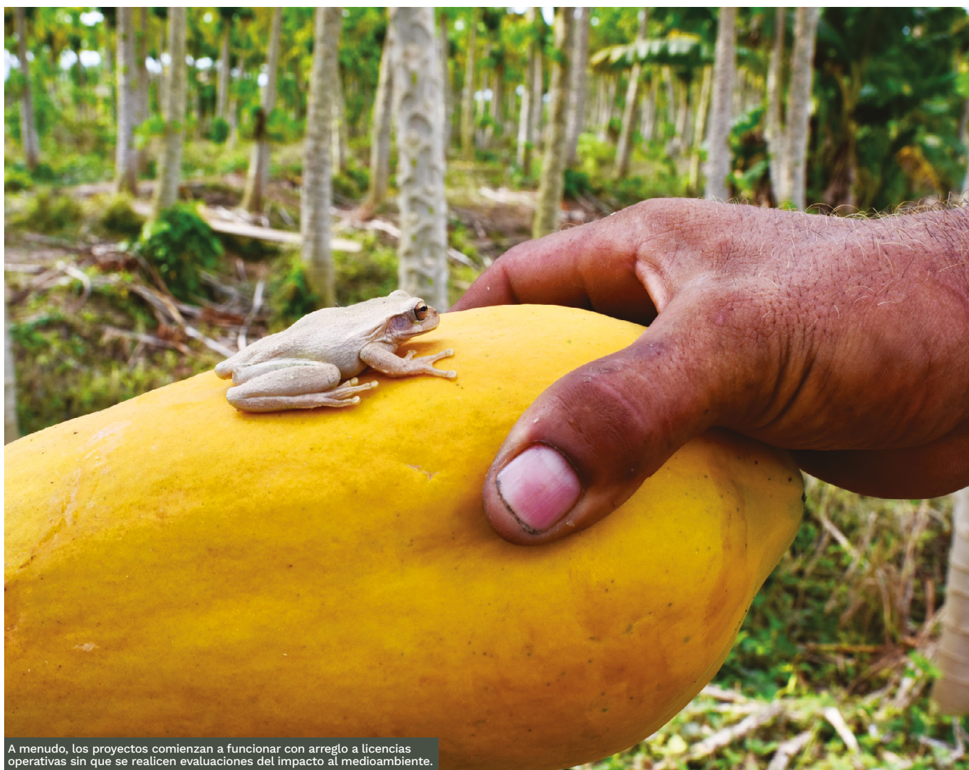
A menudo, los proyectos comienzan a funcionar con arreglo a licencias operativas sin que se realicen evaluaciones del impacto al medioambiente.