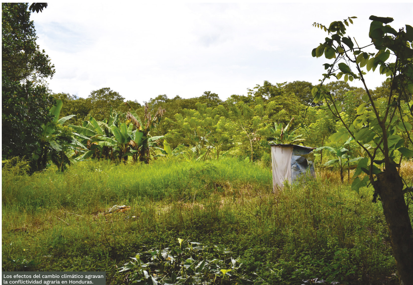
Los efectos del cambio climático agravan la conflictividad agraria en Honduras.

90 Otros factores que agravan la conflictividad agraria es el debilitamiento del Estado de Derecho y los altos niveles de corrupción. Aunque su puntuación ha tenido una pequeña mejora en el último índice de Estado de Derecho del World Justice Project , el país ocupa el puesto 116 de 142 países evaluados en 2024, y el puesto 27 entre los 32 países de América Latina y el Caribe 69 . A su vez, figura en la posición 154 entre los 180 evaluados por Transparencia Internacional en su índice de percepción de la corrupción de 2024. Transparencia Internacional ha resaltado los siguientes problemas enfrentados por el país: 1) falta de resultados tangibles en la lucha contra la corrupción; 2) persistencia de estructuras de impunidad en diferentes esferas del gobierno y demás instancias del Estado; 3) retraso en la instalación de una Comisión Internacional Contra la Corrupción y la Impunidad, pese a la promesa del gobierno de Xiomara Castro 70 ; y 4) la corrupción estructural en el sector privado. Al analizar este último factor, Transparencia Internacional subrayó que “la violencia contra los defensores ambientales ha aumentado de manera alarmante” y que “en 2023, la impunidad por delitos ambientales alcanzó un alarmante 96.9%, lo que refleja la ineficiencia del sistema de justicia para sancionar estos crímenes” 71 .